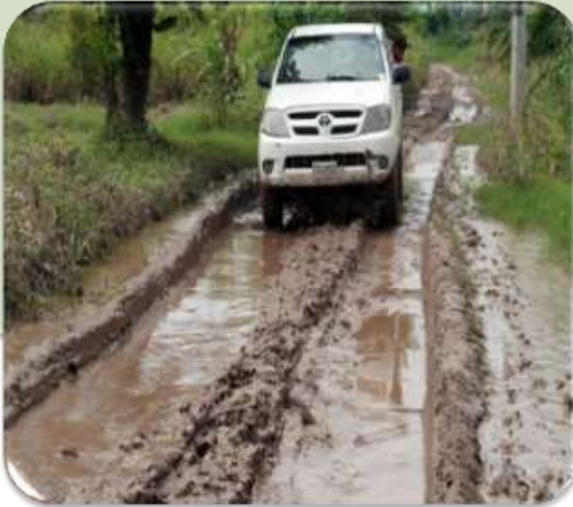
CAMINOS RURALES EN MAL ESTADO