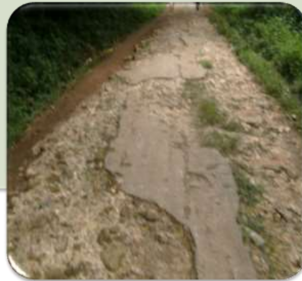
CAMINOS RURALES EN MAL ESTADO