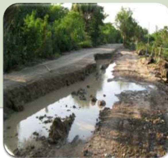
OBRAS CON DEFICIENCIAS TECNICAS