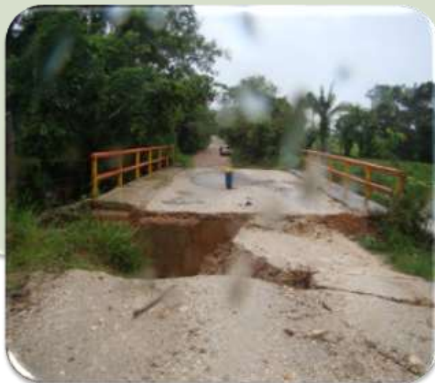
OBRAS CON DEFICIENCIAS TECNICAS