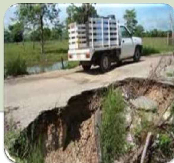
OBRAS CON DEFICIENCIAS TECNICAS