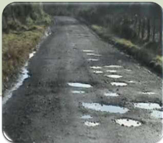
OBRAS CON DEFICIENCIAS TECNICAS