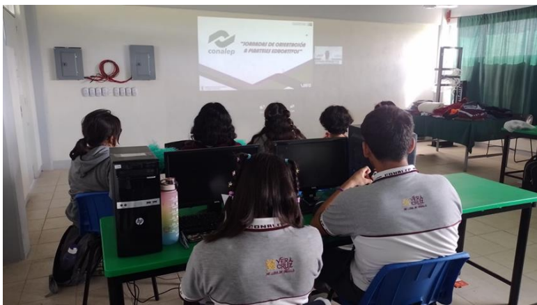
Jornada de Capacitación al CONALEP 320 Xalapa, Ver.