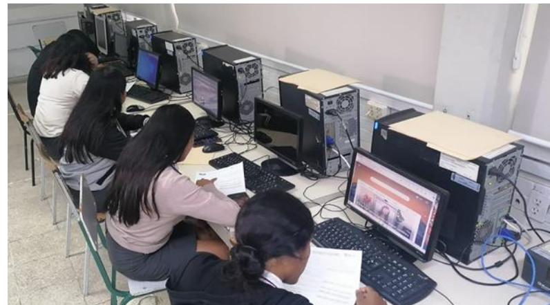
Jornada de Orientación a CONALEP 103 Potrero, Ver.