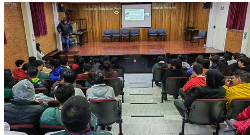
Jornada de Orientación a CONALEP 252 Orizaba, Ver.