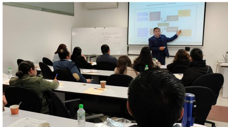
Jornada de Capacitación a Maestría en Auditoría de la Facultad de Contaduría, UV campus Xalapa, Ver.