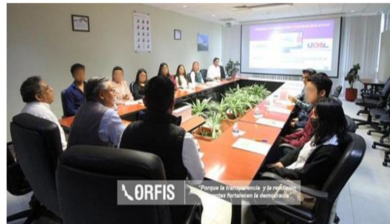
Jornada de Capacitación a la Universidad de América Latina campus Xalapa desde instalaciones del ORFIS