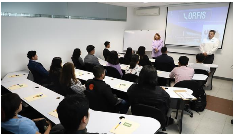
Jornada de Capacitación a la Universidad de América Latina campus Xalapa desde instalaciones del ORFIS