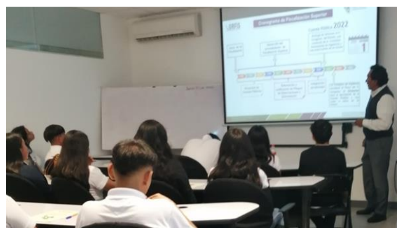
Jornada de Capacitación a la Universidad Tecnológica de Gutiérrez Zamora, Ver.