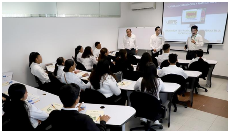
Jornada de Capacitación al Instituto Tecnológico Superior de Pánuco desde instalaciones del ORFIS