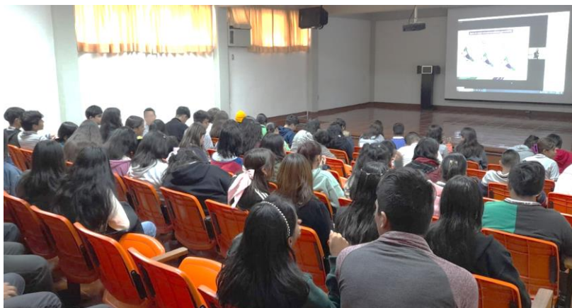
Jornada de Orientación a CONALEP 244 Papantla, Ver.