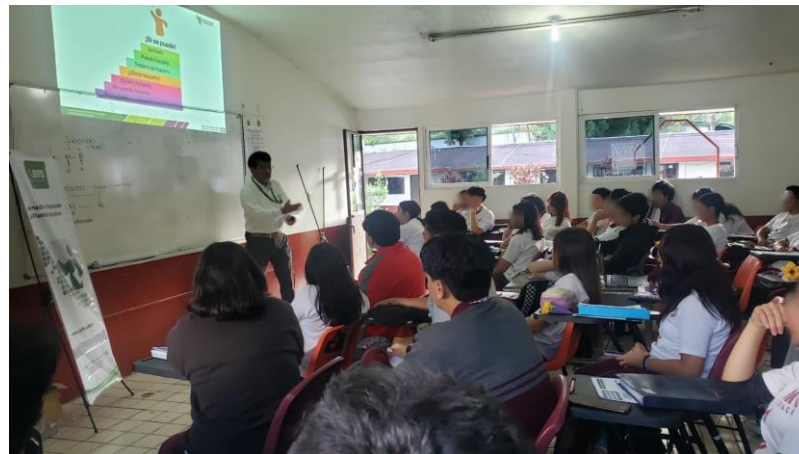
Jornada de Capacitación al COBAEV 66 campus Xalapa, Ver.