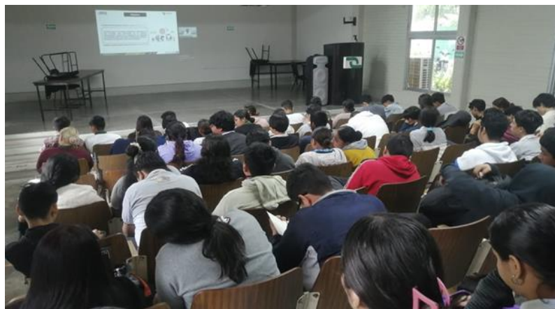
Jornada de Orientación a CONALEP 122 Carlos A. Carrillo, Ver.