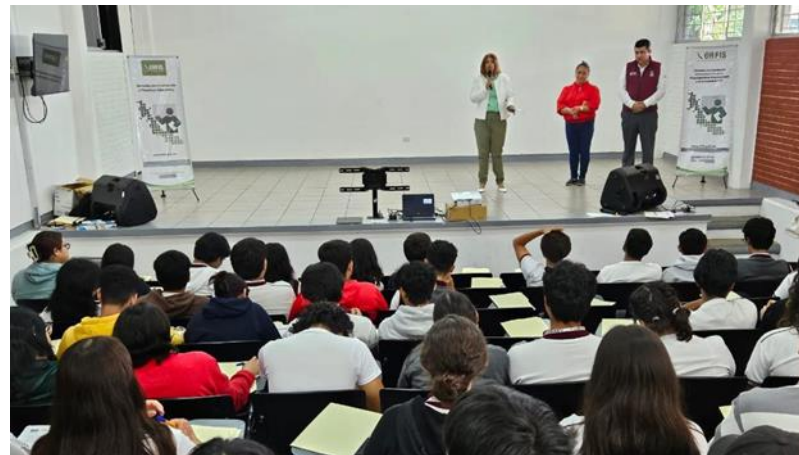
Jornada de Capacitación al COBAEV 35 campus Xalapa, Ver.