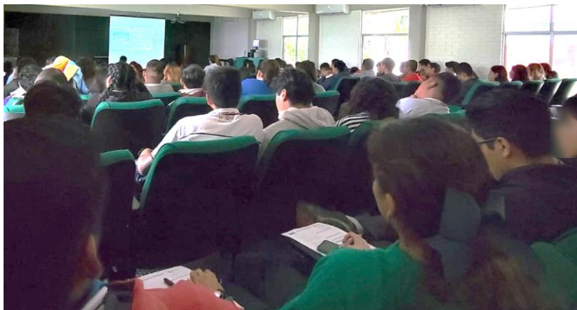
Jornada de Orientación a CONALEP 165 Tuxpan, Ver.