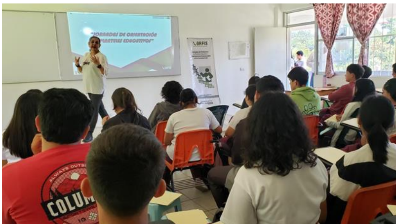
Jornada de Capacitación al COBAEV 52 campus Cosautlán de Carvajal, Ver.