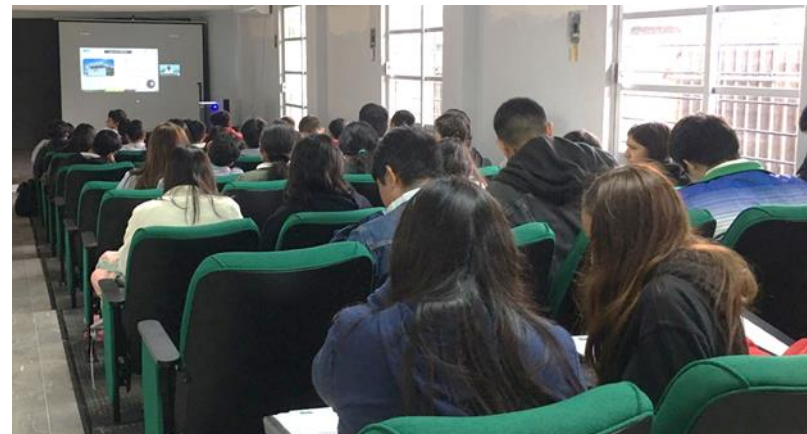
Jornada de Orientación a CONALEP 177 Poza Rica, Ver.