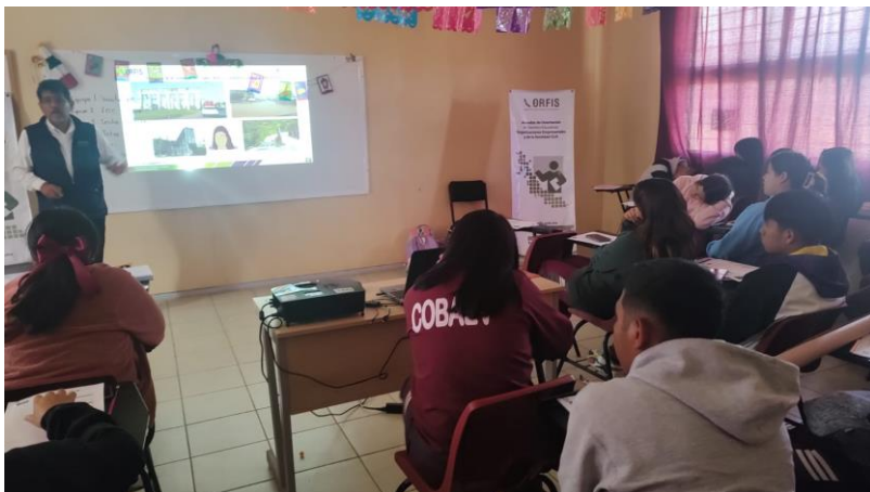
Jornada de Capacitación al COBAEV 58 campus Perote, Ver.