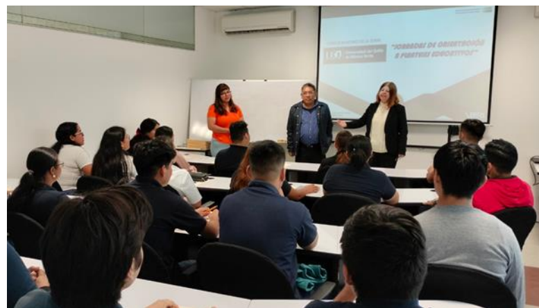
Jornada de Capacitación a la Universidad del Golfo de México Norte campus Martínez de la Torre, Ver.