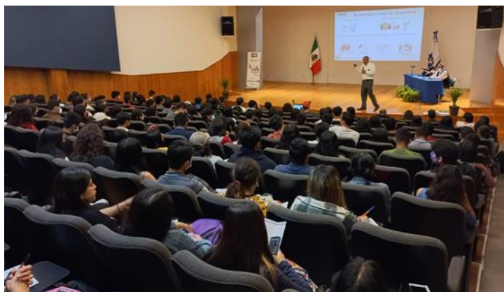
Facultad de Contaduría, Universidad Veracruzana Xalapa, Ver.