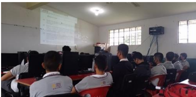
Jornada de Capacitación al CONALEP Vega de Alatorre, Ver.