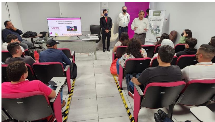
Universidad Euro Hispanoamericana Xalapa, Ver.