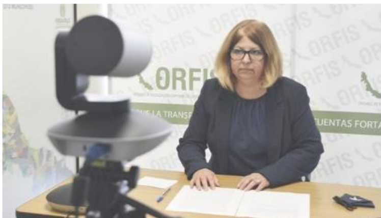
Jornada de Capacitación al Instituto Tecnológico de Cosamaloapan desde instalaciones del ORFIS