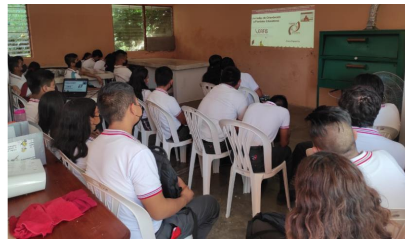
Jornada de Orientación a Telebachilleratos de la zona de Papantla, Ver.