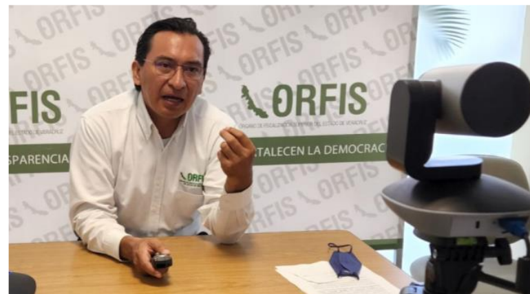
Jornada de Capacitación al Instituto Tecnológico de Cosamaloapan desde instalaciones del ORFIS