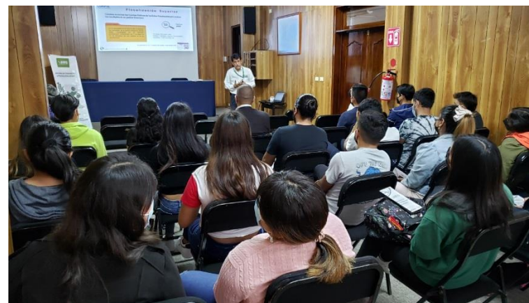
Universidad IVES, Xalapa, Ver.