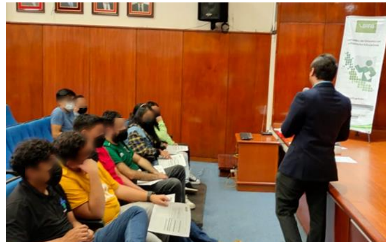
Facultad de Derecho, Universidad Veracruzana, Xalapa, Ver.