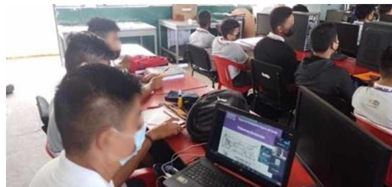
Jornada de Capacitación al CONALEP Vega de Alatorre, Ver.