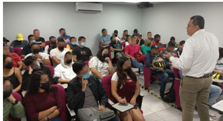
Universidad Euro Hispanoamericana Xalapa, Ver.