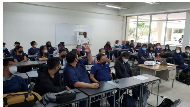
Facultad de Odontología, Universidad Veracruzana, Xalapa, Ver.