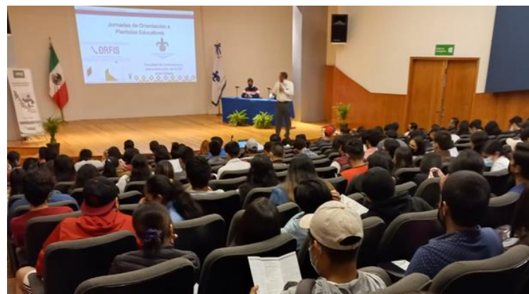
Facultad de Contaduría, Universidad Veracruzana Xalapa, Ver.