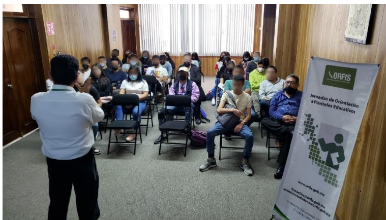
Universidad IVES, Xalapa, Ver.