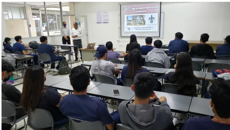
Facultad de Odontología, Universidad Veracruzana, Xalapa, Ver.