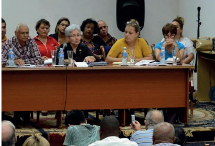
Contralora Gladys Bejerano en presentación del Balance del desempeño del Sistema de Auditoría en Camagüey.

La Contralora General de la República, Gladys Bejerano Portela, lanzó en la provincia de Camagüey la convocatoria a realizar auditorías estratégicas en todo el país, de forma simultánea con la XIV Comprobación al Control Interno (CNCI) que se realizará del 6 de abril al 21 de mayo en 321 entidades económicas seleccionadas.