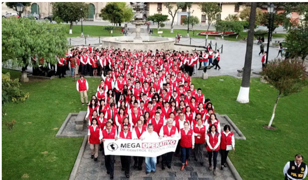
Inicio de Mega Operativo de Control Regional en Cajamarca, Perú.

El lunes 9 de marzo, el Contralor General de la República del Perú, Nelson Shack, dio inicio al primer Mega Operativo de Control Regional en la región de Cajamarca con el despliegue masivo de cerca de 700 auditores y especialistas de la entidad superior de control, quienes realizarán intervenciones en las principales entidades públicas ubicadas en las trece provincias de la región. Los auditores realizarán un total de 760 intervenciones, de las cuales, 352 serán servicios de control posterior y simultáneo, mientras que se ejecutarán 408 acciones de prevención e integridad.