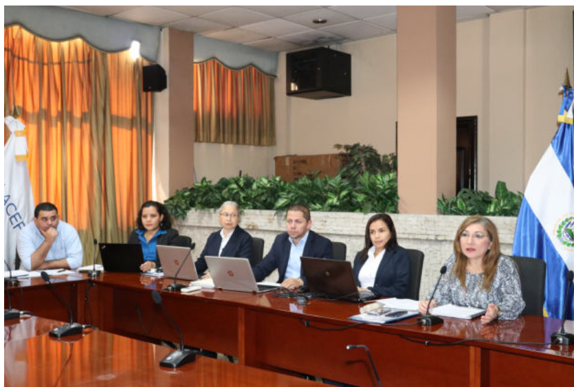
Equipo de EFS El Salvador participando de taller virtual.

En seguimiento a las actividades de la iniciativa “Estrategia, Medición de Desempeño e Informes”, SPMR (por sus iniciales en inglés), implementada en la región de la OLACEFS, en colaboración con la IDI-INTOSAI, se llevó a cabo el Segundo Taller Virtual sobre la evaluación del Capítulo 4, correspondiente a la Metodología del Marco de Medición del Desempeño (MMD), proceso que está ejecutando actualmente la Corte de Cuentas de la República de El Salvador en conjunto con las EFS de Honduras, Perú y Ecuador.