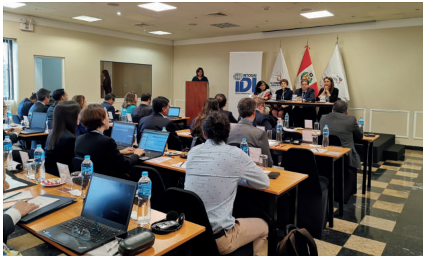
Inauguración del Taller de Compras Públicas Sostenibles utilizando análisis de datos (CASP).

Considerando la experiencia de la OLACEFS en auditorías coordinadas de preparación de la Agenda 2030, el presente año, la IDI y OLACEFS, decidieron continuar fortaleciendo la cooperación existente e impulsar una auditoría cooperativa sobre implementación de los ODS, la cual tiene como EFS coordinadora a la Contraloría General de la República de Costa Rica.