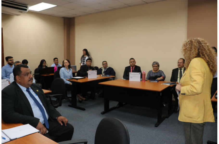
Capacitaciones realizadas sobre Sistema Integrado para el Control de Auditorías (SICA).

Directores y subdirectores de Auditoría de la Corte de Cuentas de la República de El Salvador, fueron capacitados sobre el Sistema Integrado para el Control de Auditorías (SICA), Generalidades Módulo de Planificación y Programación y Módulo de Asignación de Trabajo, el cual está próximo a implementarse.