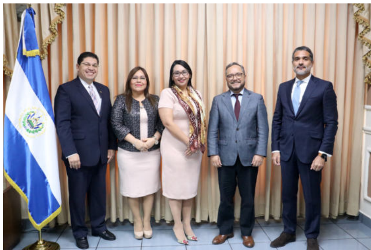
Titulares de la EFS de El Salvador acompañados de representantes de OEA-CICIES.

Los acercamientos entre la Entidad Fiscalizadora y la OEA-CICIES se desarrollan desde el año pasado, a fin de definir el apoyo técnico que el Organismo Superior de Control del Estado salvadoreño solicitará al referido organismo.