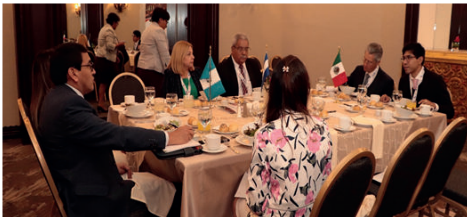
Reunión de las EFS de México, Guatemala, Honduras y El Salvador.