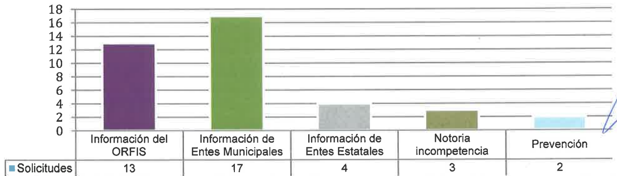
Solicitudes desagregadas por el tipo de información requerida

Ahora bien, las 39 solicitudes de acceso a la información recibidas, se reportan atendidas en los siguientes términos: -----