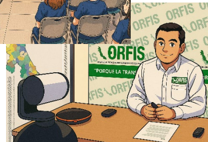
Imagen generada con IA