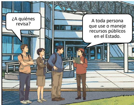
Imagen generada con IA