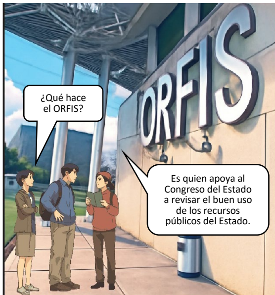
Imagen generada con IA