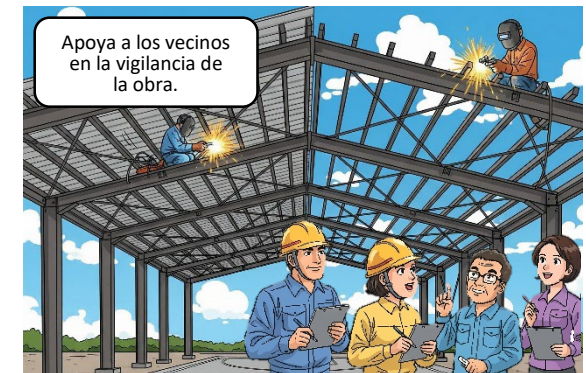
Imagen generada con IA