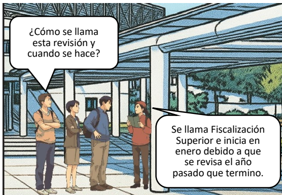
Imagen generada con IA