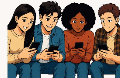
Imagen generada con IA