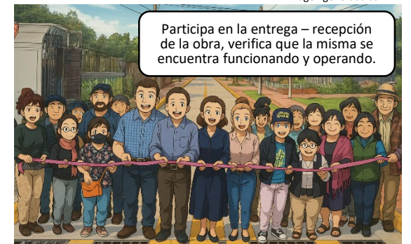
Imagen generada con IA