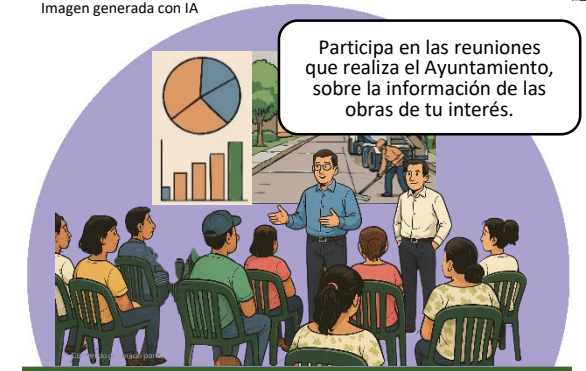
Imagen generada con IA