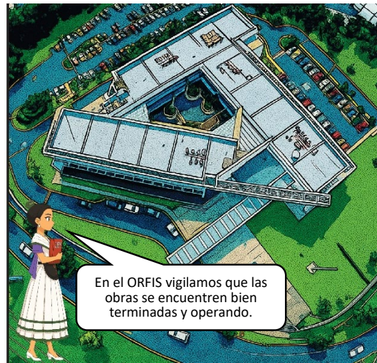
Imagen generada con IA

El ORFIS dentro del programa “ Jornadas de Orientación en Planteles Educativos ” dirigido a instituciones de enseñanza superior, media superior y superior, en el cual a través de charlas ya sea en sus escuelas o en nuestras instalaciones, explicamos de forma sencilla que hacemos, las herramientas que hemos creado para que la gente pueda informarse y ser parte de la vigilancia de los recursos públicos.