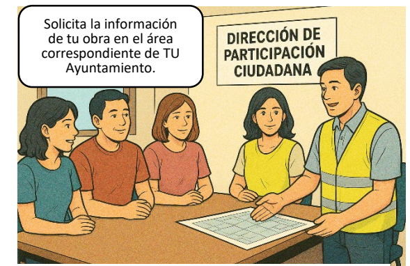
Imagen generada con IA