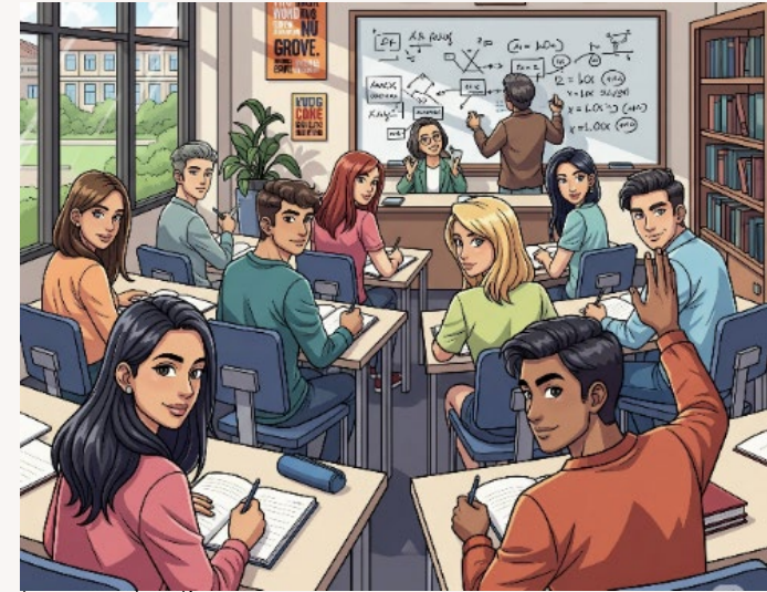
Imagen generada con IA